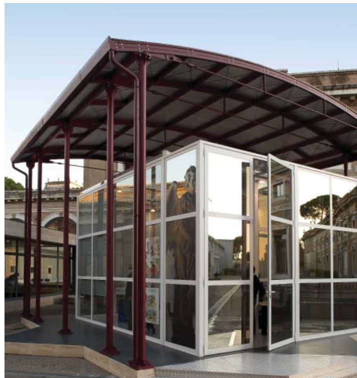
il "Laboratorio Trasparente" nel cortile della zitella