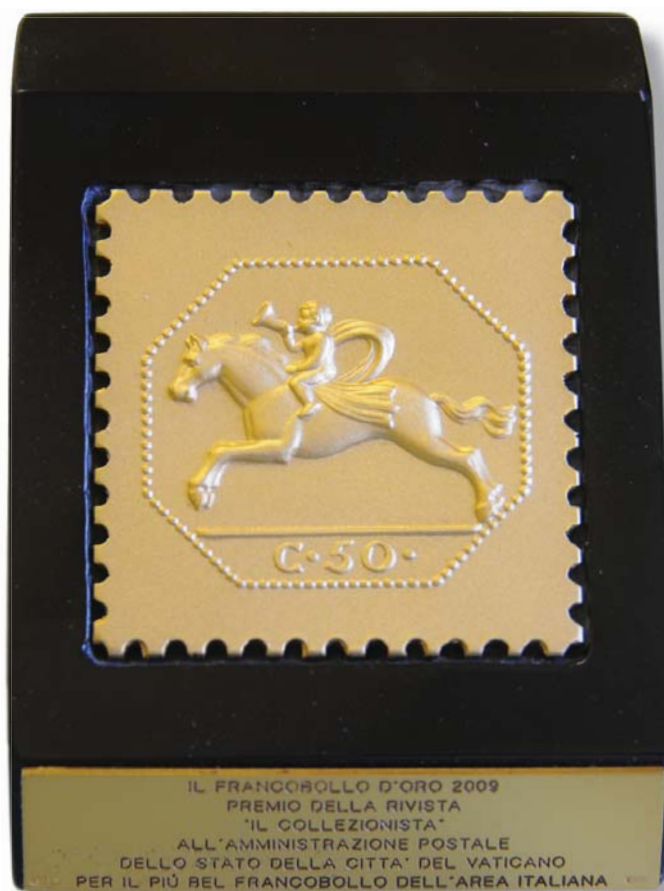
Premio "francobollo d'oro"

E che dire degli agoni atletici, in modo particolare il grande incontro amichevole della "Nazionale" di calcio dello