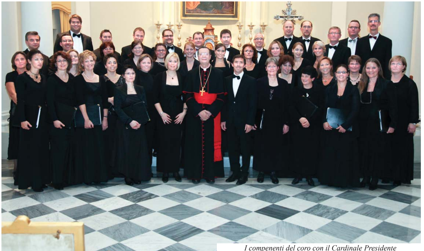
I componenti del coro con il Cardinale Presidente