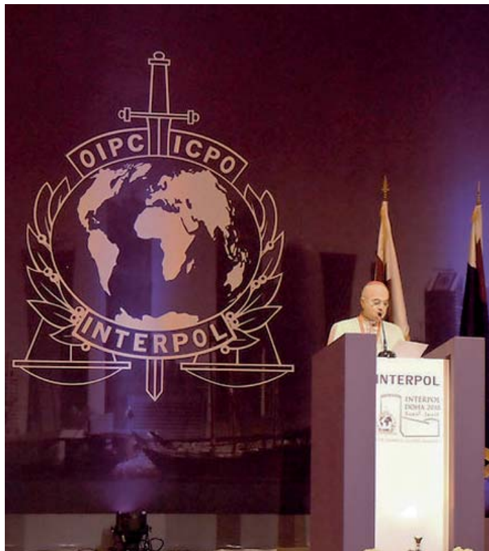
S.E. Mons Carlo Maria Viganò durante l'Assemblea

La prossima Assemblea Generale di terrà nel Vietnam.