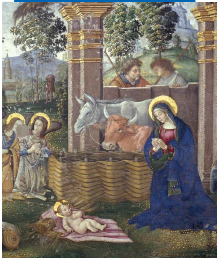
BERNARDINO DI BETTO DETTO IL PINTURICCHIO, NATIVITÀ, APPARTAMENTO BORGIA (MUSEI VATICANI), "PARTICOLARE".