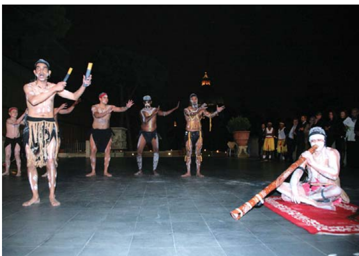
Danzatori e musicisti aborigeni

Completa la mostra l'esposizione di alcune preziosissime opere dell'Oceania: si va da un grande copricapo in piume della Papua Nuova Guinea, alle misteriose statue dell'Isola di Pasqua; da una statua in legno della Madonna con Bambino delle isole Salomone alle statue delle isole Gambier, nella Polinesia Francese.