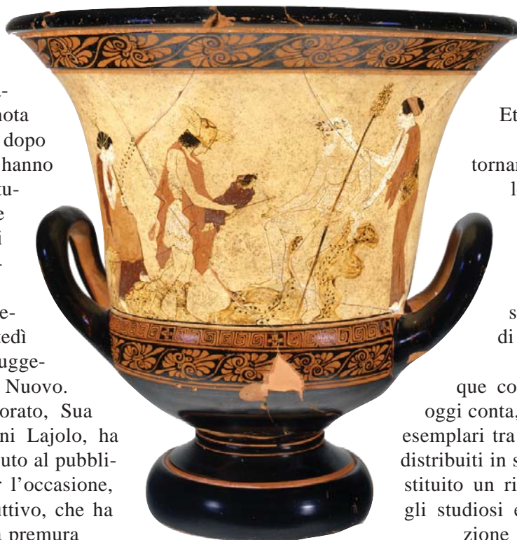
Cratere a calice attico a fondo bianco del Pittore della Phiale: Hermes consegna Dioniso bambino al vecchio sileno. 440-430 a.C. (Musei Vaticani)

La visita alle nuove sale è stata introdotta dagli interventi di An-