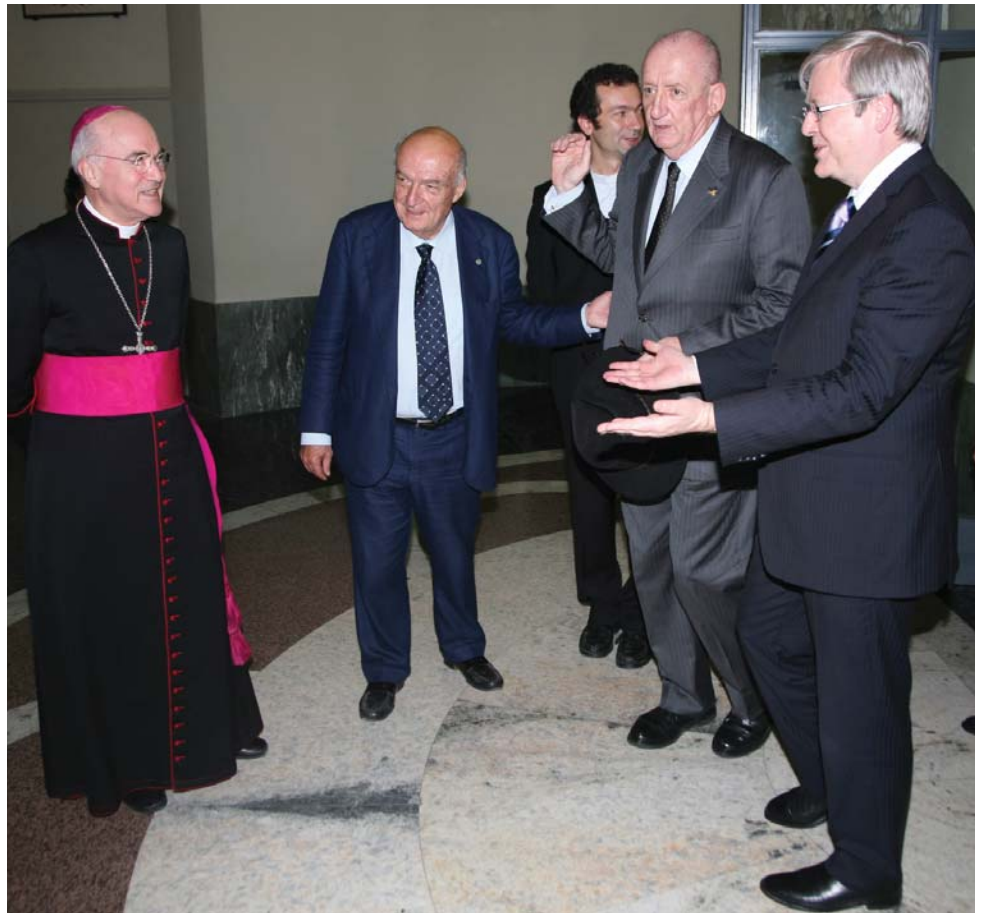
S.E. Carlo Maria Viganò con il ministro degli esteri australiano Kevin Rudd

Tra tutte le opere esposte spicca un dipinto su corteccia, ora schiarito, dove si intravede il volto di uno spirito Wandjina. Se-