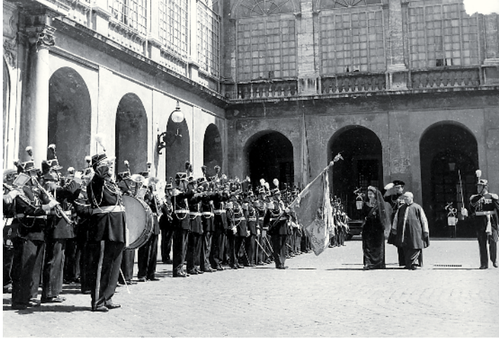
La Regina Elisabetta II d'Inghilterra mentre riceve gli Onori nel Cortile di San Damaso nel corso della visita a Papa Giovanni XXIII.