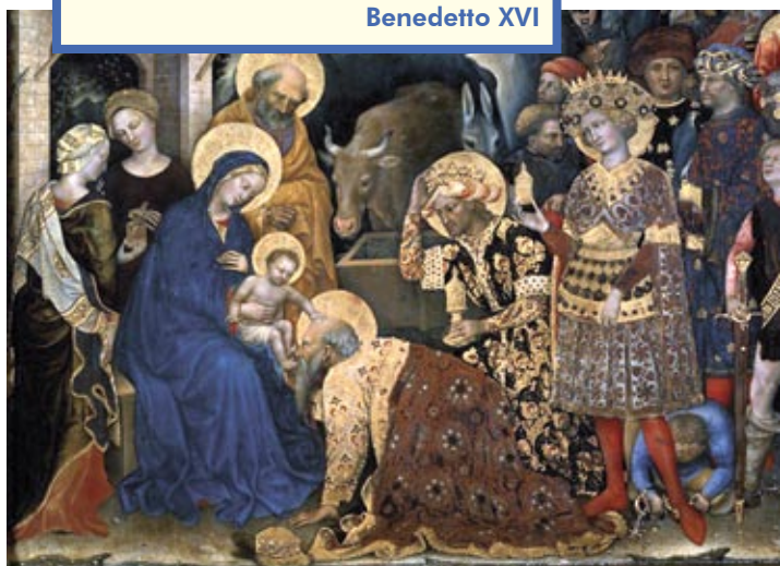
Adorazione dei Magi, dettaglio (1423) Gentile da Fabriano, (c.1370-1427) Galleria degli Uffizi, Firenze

Non so, cari Amici, se questa piccola composizione possa suscitare in voi qualche pensiero. Essa vorrebbe suggerire che Colui che ci salva – Gesù! – si presenta nella nostra storia al di fuori di schemi cari ai disegni umani. È solo il frutto Benedetto della Vergine. Amore che riscalda il nostro buio egoismo. Nuova visione della vita. Canto del Cielo che apre alla speranza.