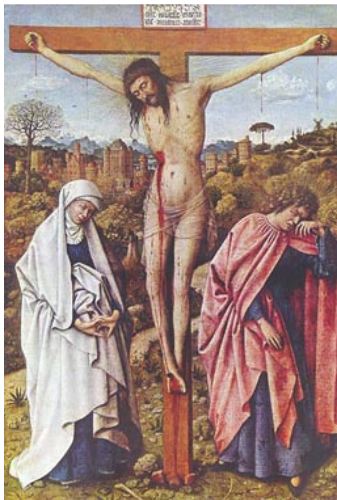
Crocifissione Hubert van Eyck (c. 1370 - 1426) Staatliche Museen, Berlino.

La Passione di Cristo, Romano il Melode, Inni [continua]