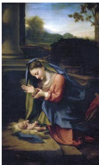
Madonna adorante il bambino, 1525 circa. Correggio. Firenze, Galleria degli Uffizi