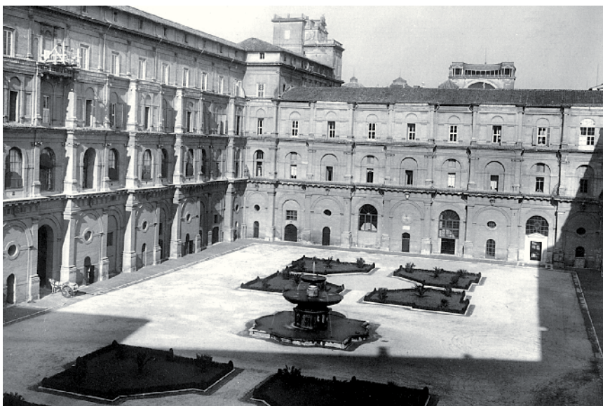
Foto storica (inizio '900) del Cortile del Belvedere, lato nord-occidentale con il braccio di Sisto V, realizzato dall'architetto Domenico Fontana fra il 1585 e il 1588 e destinato alla Biblioteca Apostolica Vaticana. Sullo sfondo si intravedono la sommità del Nicchione sovrastante il Cortile della Pigna e la Torre dei Venti. La fontana, al centro del cortile, è ancora circondata dai riquadri erbosi con cespugli e palmizi che vennero eliminati negli anni '60, per fare posto al parcheggio delle autovetture.

C'erano, poi, i concerti tenuti in occasioni speciali, come l'anniversario dell'Incoronazione o l'onomastico del Pontefice. Fu durante le prove nel Cortile del Triangolo per uno di questi concerti che il Maestro e la Banda, impegnati a mettere a punto l'esecuzione di un brano di Wagner, ricevettero una visita inattesa: il segretario particolare del Papa che riportò una richiesta personale di Giovanni XXIII. “Si poteva suonare – mandava a dire Sua Santità – qualcosa di più allegro?”. Incerti del mestiere di Direttore della Banda della Guardia Palatina d'Onore di Sua Santità.