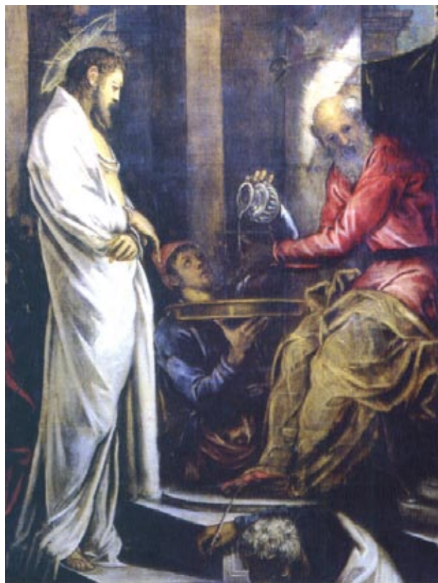
Gesù davanti a Pilato, Jacopo Robusti detto il Tintoretto. Scuola di S. Rocco, Venezia