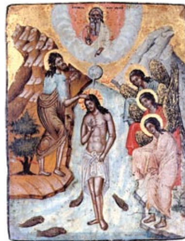
Arte Russa, sec. XVI Il Battesimo di Gesù Pinacoteca Vaticana Sala XVIII

Non è senza significato che i Musei Vaticani, Musei identitari del cattolicesimo universale, abbiano una sezione dedicata alle icone e che, di questa, il primo nucleo collezionistico sia antico di tre secoli.