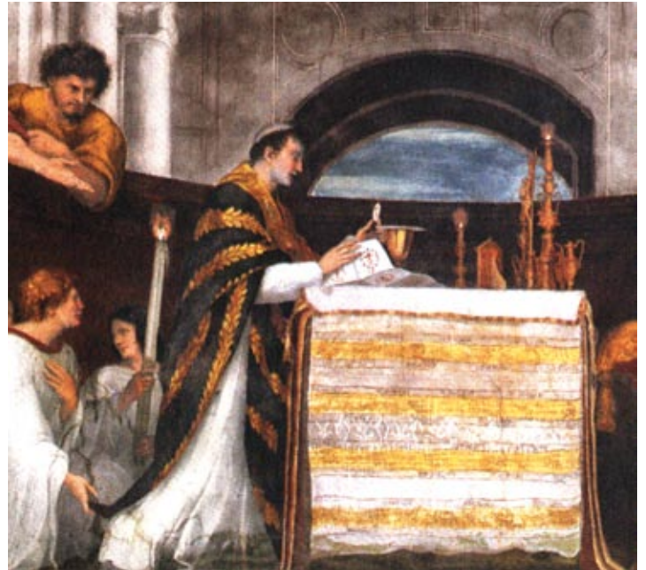
La Messa di Bolsena (particolare), Raffaello Sanzio (1483-1520). Stanze di Raffaello, Musei Vaticani

2. Il culto dell'amore che si rende visibile nel mistero della Croce, ripresentato in ogni Celebrazione eucaristica, costituisce quindi il fondamento perché noi possiamo divenire persone capaci di amare e donarsi (cfr. Enc. Haurietis aquas , 69), divenendo strumento nelle mani di Cristo: solo così si può essere annunciatori credibili del suo amore. Questo aprirsi alla volontà di Dio, però, deve rinnovarsi in ogni momento: "L'amore non è mai 'finito' e completo" (cfr. Enc. Deus caritas est , 17).