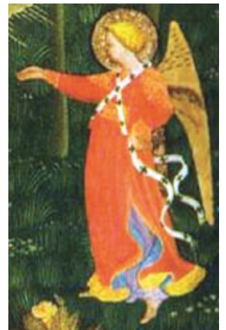
Beato Angelico, Il Paradiso (particolare), Accademia di Belle Arti, Firenze

La campana ha chiamato e l'angelo è venuto. Lieve lieve ha sfiorato con l'ala di velluto il povero paese; v'ha sparso un tenue lume di perla e di turchese e un palpito di piume; ha posato i dolci occhi su le più oscure soglie ... Poi, con gli ultimi tocchi, cullati come foglie dal vento della sera, se n'è volato via: a portar la preghiera degli umili a Maria.